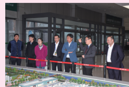
图三：参观项目沙盘