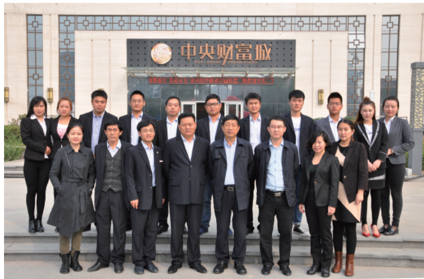
▲ 产业集团领导与项目团队合影

经济学家厉以宁说：“员工幸福感越大，工作效率也越高，企业的效益也将水涨船高。”员工是企业最大的财富，加强人文关怀，让员工产生幸福感、认同感和归属感，进而激发员工的积极性，最终转化为生产力，开创员工与集团同心同德、共进共赢的良好局面。