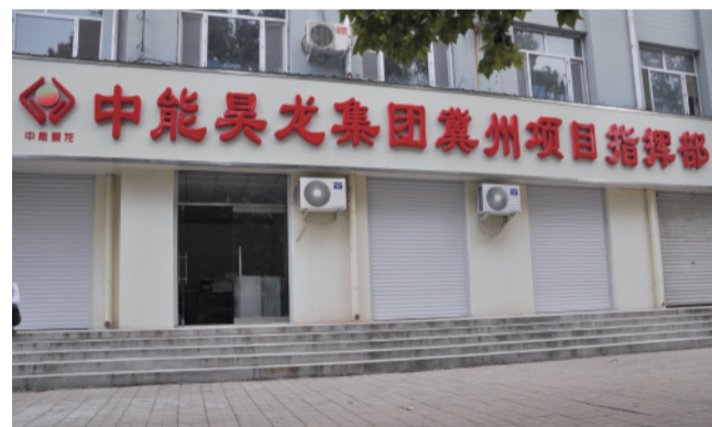
▲中能昊龙衡水产业集团冀州项目指挥部